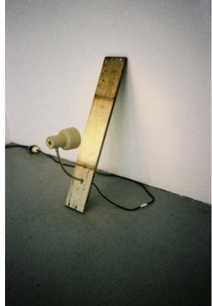
Installationsansicht: Michael Bodenmann, Lamp for Seyðisfjörður , 2015. Lampe, Holz, Stromkabel

Michael Bodenmann studierte Fotografie und Bildende Kunst an der ZHdK in Zürich. Ausgewählte Ausstellungen: Night Collection, ehem. Restaurant Eintracht, Appenzell (2022), Logic of Sensation, 5th Shenzhen International Photography Exhibition, OCT Loft Shenzhen (2021), Work Life Balance, Nextex St.Gallen (2020), Synchronicity, Pingshan Art Museum, Shenzhen (2019), Art on plein air, Môtiers (2015).